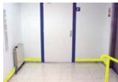
Il contrasto di colori aiuta la mobilità