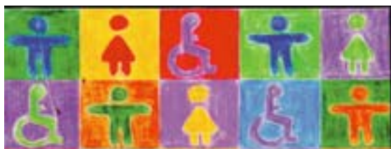
Disegno: Marina Wirlitsch, Anno europeo delle persone con disabilità 2003

Le persone con disabilità dovrebbero godere di un trattamento equo sul lavoro e quindi anche in materia di salute e sicurezza. La salute e la sicurezza non devono diventare una scusa per non assumere o per continuare a non assumere persone disabili. Inoltre, un luogo di lavoro che è accessibile e sicuro per i disabili è a maggior ragione più sicuro e più accessibile per tutti i dipendenti, clienti e visitatori. Le persone con disabilità sono coperte tanto dalla legislazione europea contro la discriminazione quanto da quella concernente la salute e la sicurezza sul lavoro. Tale legislazione, che gli Stati membri recepiscono nella legislazione e negli ordinamenti nazionali, dovrebbe essere applicata per facilitare l'occupazione di persone con disabilità e non per escluderle.